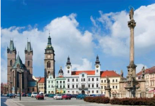
Lieu : Poděbrady (spa town), Pardubice and Hradec Králové area in Czechia