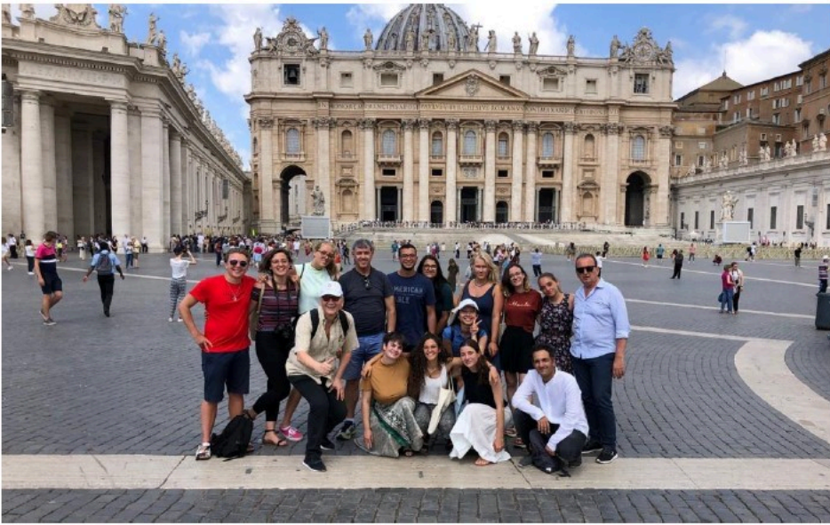
Lieu : Rome et environs - Italie