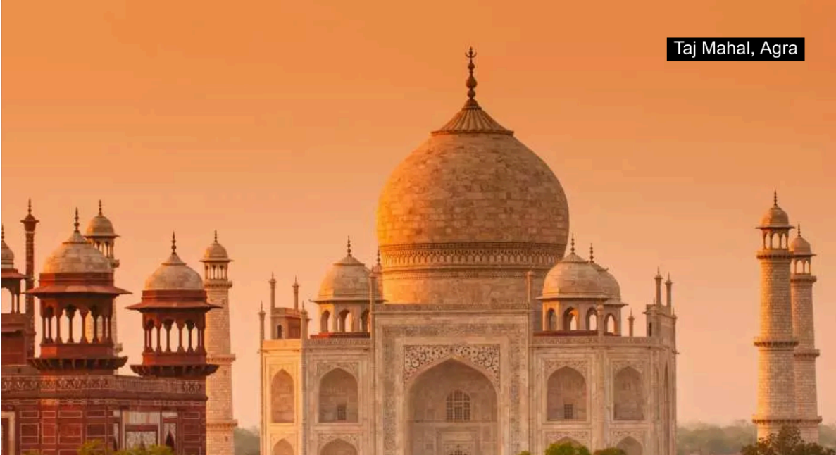
Taj Mahal, Agra

Not just a trip, but a transformation. Discover India. Discover Yourself.