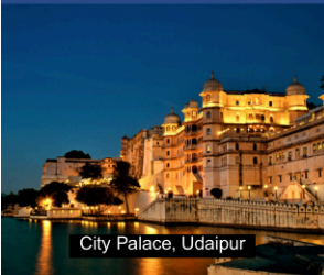
City Palace, Udaipur

Cultural Youth Camp 27th Dec 25 to 8th Jan 26