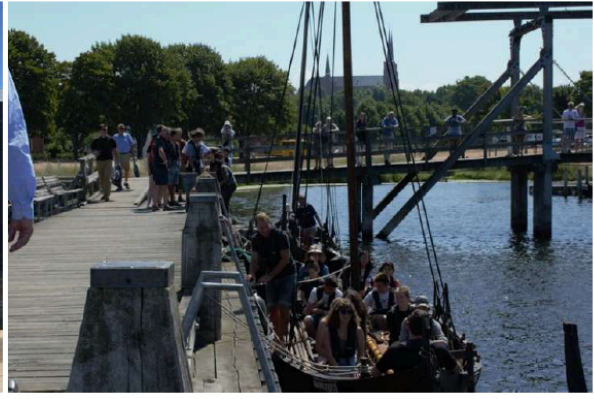
Lieu : Région de Roskilde