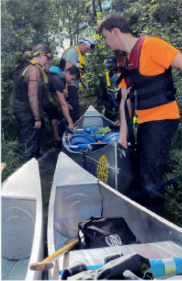
A 200-kilometre canoe trip in two-person, aluminum canoes, in 7 Days in the Canadian Shield.